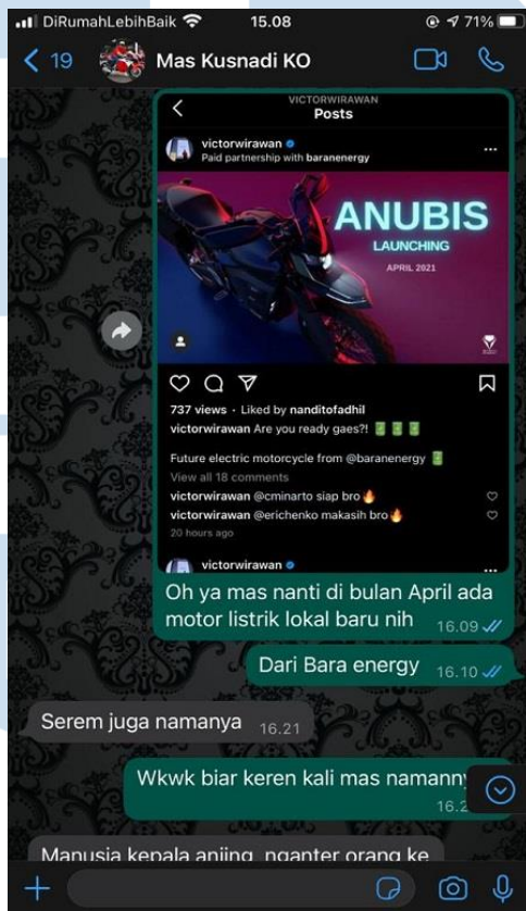
Gambar 8 Penulis mengajukan liputan peluncuran motor listrik