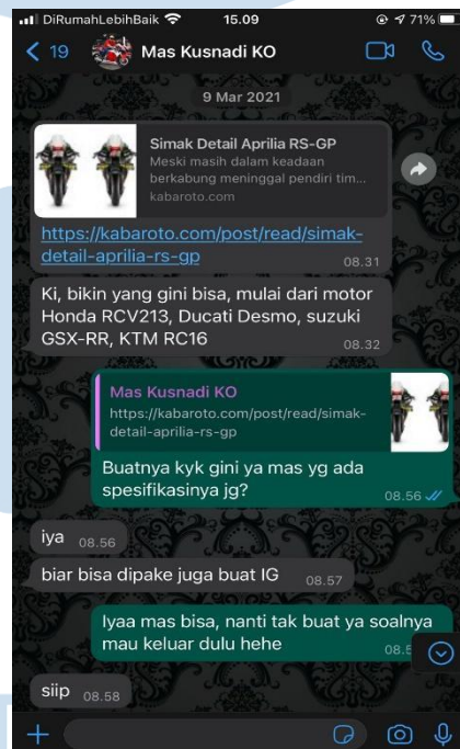
Gambar 6 Penugasan Via WhatsApp