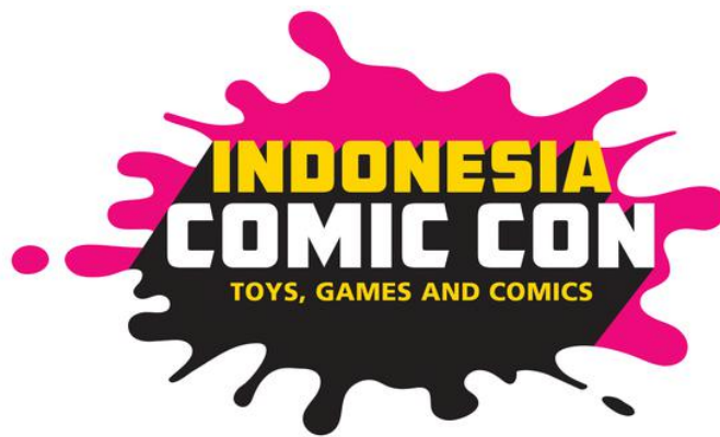
Gambar 2.4 Logo Indonesia Comic Con