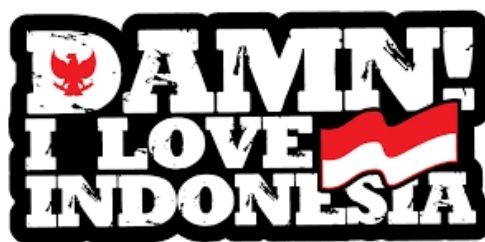
Gambar 2.3 Logo Damn I love Indonesia