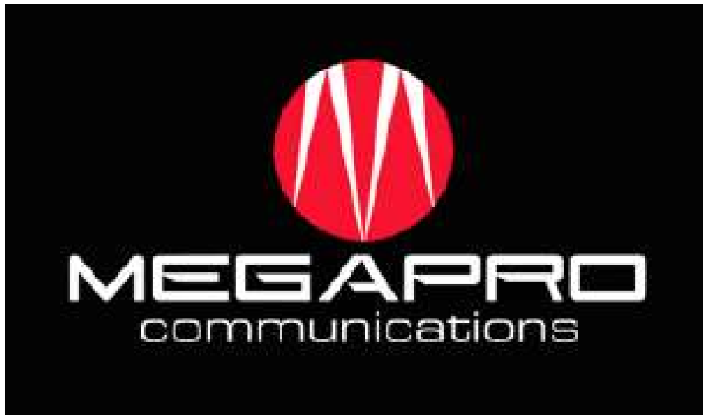
Gambar 2.2 Logo Megapro Communications (Dokumentasi Perusahaan)

Logo dari Megapro Communications terdiri dari huruf M berwarna putih dengan background lingkaran merah, serta tulisan “Megapro Communications” berwarna putih. Huruf M yang berwarna putih sendiri didesain sedemikian rupa agar menyerupai lampu sorot panggung, mencerminkan akar sejarah Megapro Communications yang sangat melibatkan musik. Warna merah digunakan untuk memberi kesan kemudaan, kesegaraan, serta kegembiraan, cocok dengan identitas Megapro Communications sebagai event organizer . Selain itu, warna merah juga sangat menarik perhatian mata. ”. (Tobias, 2021)