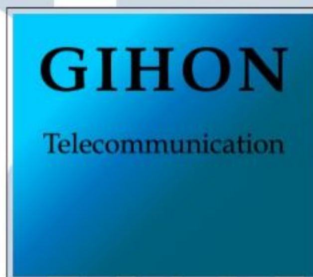
Gambar 2.1. Logo PT Gihon Telekomunikasi Indonesia TBK sumber: [2]

PT Gihon Telekomunikasi Indonesia telah berdiri sejak tanggal 27 april 2001 di Jakarta. Bidang usaha utama dari PT Gihon Telekomunikasi Indonesia Tbk adalah bidang Tower Telekomunikasi. Tim inti dari PT Gihon Telekomunikasi Indonesia Tbk telah memiliki pengalaman sejak tahun 1996 pada bidang Tower dan Selular Industri. Hingga saat ini PT Gihon Telekomunikasi Indonesia Tbk telah menjadi perusahaan investasi dengan Portofolio pada bidang Industri Leasing Tower, Utilitas, Mikrokontroler, Serat Optik dan Jaringan Aktif. Layanan utama PT Gihon Telekomunikasi Indonesia meliputi Jasa Teknik, Desain, Konstruksi, Instalasi dan Integrasi Jaringan, yang didedikasikan untuk Industri Telekomunikasi.[2] Logo dari PT Gihon Telekomunikasi Indonesia dapat dilihat pada gambar 2.1.