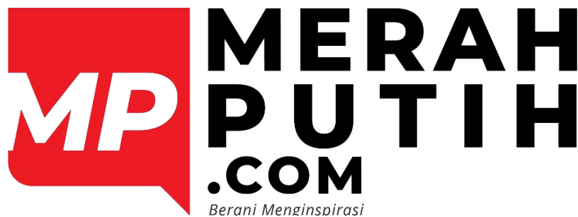
Gambar 2.1 Gambar Logo Merahputih

Visi Merahputih menunjukkan komitmen perusahaan menjadi tangguh, modern, dipercaya, dan memberikan inspirasi ke pembaca. Selanjutnya, media daring asal Tangerang Selatan ini memunculkan sejumlah misi sebagai bentuk aksinya. Pertama, mereka menjalankan manajemen profesional, secara disiplin, efektif, tapi efisien. Kedua, media selalu menyajikan ide kreatif mendukung suara masyarakat. Mereka dituntut konsisten menghasilkan pemberitaan relevan dengan peristiwa di pelosok Indonesia. Ketiga media ini mengembangkan disiplin organisasi dan pemberdayaan karyawan. Tujuannya supaya seluruh karyawan Merahputih menjadi sosok berintegritas dan memajukan nama media di Tangerang Selatan dan sekitar wilayah Gading Serpong.