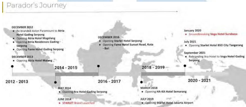
Gambar 2.2 Sejarah Parador Hotels & Resorts dari 2012-2021

Berikut merupakan gambaran singkat tentang perjalanan Parador Hotels & Resorts.