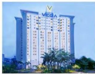
Vega Hotel Gading Serpong 3-star, 145 rooms