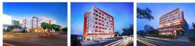
Starlet Hotel Serpong Tangerang 1-star, 109 rooms