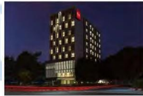
HA-KA Hotel Semarang 2-star, 90 rooms