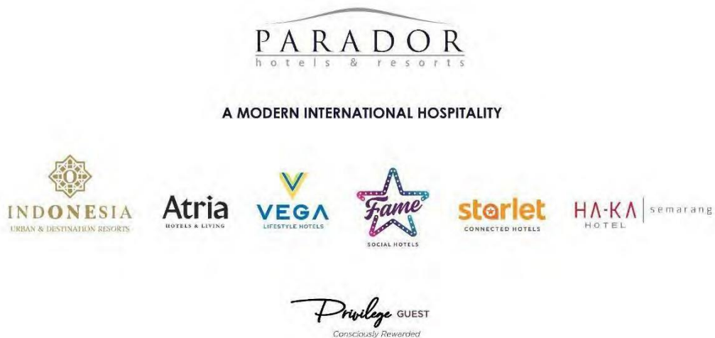
Gambar 2.1 Logo Perusahaan Parador Hotels & Resorts

Parador Hotels & Resorts atau PT Parador Management merupakan salah satu management hotel di Indonesia yang didirikan oleh perusahaan Paramount Enterprise International pada tahun 2012. PT Parador Management merupakan unit bisnis PT Paramount Enterprise International.