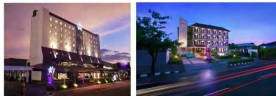
Fame Hotel Gading Serpong 2-star, 144 rooms