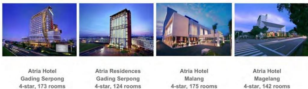
Gambar 2.3 Profil Atria Hotel & Atria Residence