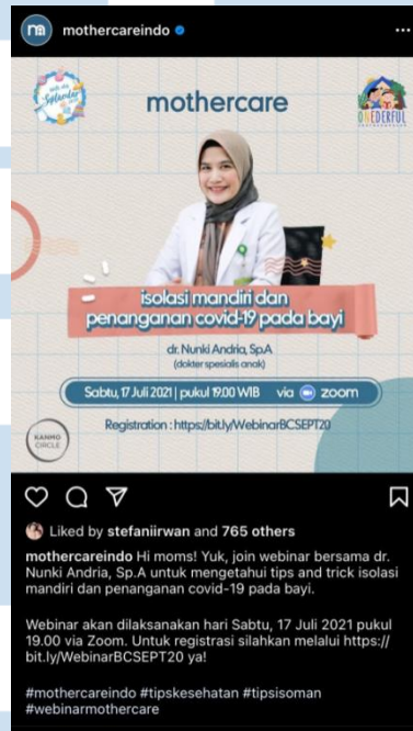
Gambar 1. 2 Konten Instagram Webinar

serta pada foto di feeds diberikan fitur View shop agar lebih mempermudah dalam mengecek harga barang.