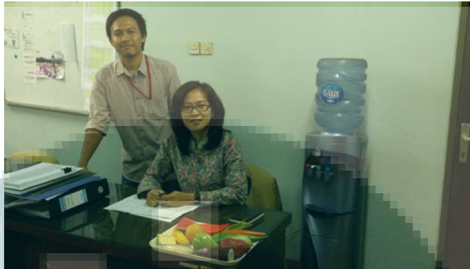
Gambar 3.2. Wawancara dengan Ahli Gizi di RS Harapan Kita