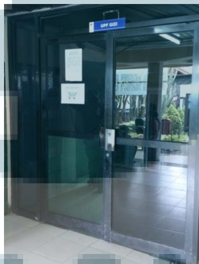
Gambar 3.1. Ruang Instalasi Gizi RS Harapan Kita

Rianti juga menjelaskan upaya untuk pencegahan Diabetes Mellitus dapat ditempuh dengan menghindari faktor resiko, faktor resiko yang dimaksud ialah pola hidup yang tidak sehat, kegemukan, kurang aktifitas fisik, dengan demikian untuk menghindari Diabetes Mellitus dapat dihindari dengan pengaturan makanan yang baik dan aktifitas fisik.