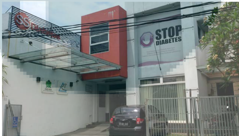
Gambar 3.3. Persadia

Persadia juga memiliki kegiatan yang aktif dalam masalah penanganan dan pencegahan diabetes baik nasional maupun internasional, meliputi; mengikuti kongres International Diabetes Federation (IDF) dan Western Pacific Region, pemilihan pandu diabetes, camp persadia, pelatihan instruktur diabetes, simposium tentang diabetes untuk tenaga kesehatan dan awam.