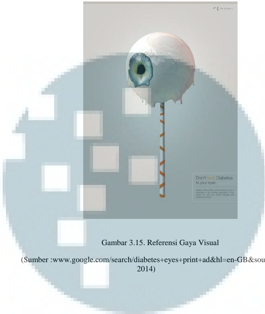
Gambar 3.15. Referensi Gaya Visual