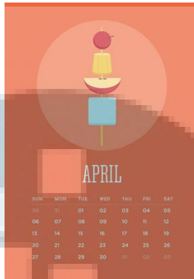
Gambar 3.14. Referensi Warna