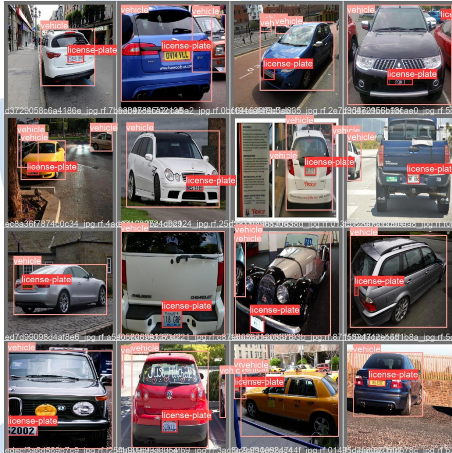
Gambar 3.2 Contoh gambar dataset

dan plat nomor dari sisi depan dan belakang kendaraan, sehingga nantinya ketika sistem ingin digunakan untuk mendeteksi kendaraan dan plat nomor dari sisi belakang, model tidak perlu di train lagi dengan dataset khusus yang memiliki gambar kendaraan dari sisi belakang.