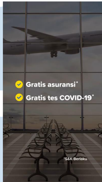
Gambar 2.2 Contoh premiums Tiket.com