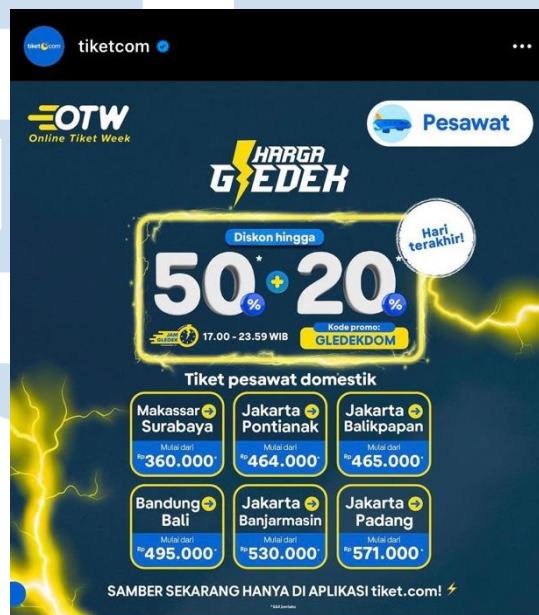
Gambar 2.1 Kode Promo yang dilakukan oleh Tiket.com

Kupon atau voucher yang dibagikan oleh Tiket.com adalah dengan tujuan agar pelanggan dapat menggunakan voucher tersebut dan mendapatkan sejumlah potongan harga. Voucher yang diberikan merupakan salah satu strategi perusahaan untuk mengait pelanggan, contohnya yaitu kode promo yang dilakukan oleh Tiket.com dengan memasukkan kode promo tersebut pelanggan akan mendapatkan sejumlah potongan harga yang menguntungkan pelanggan.