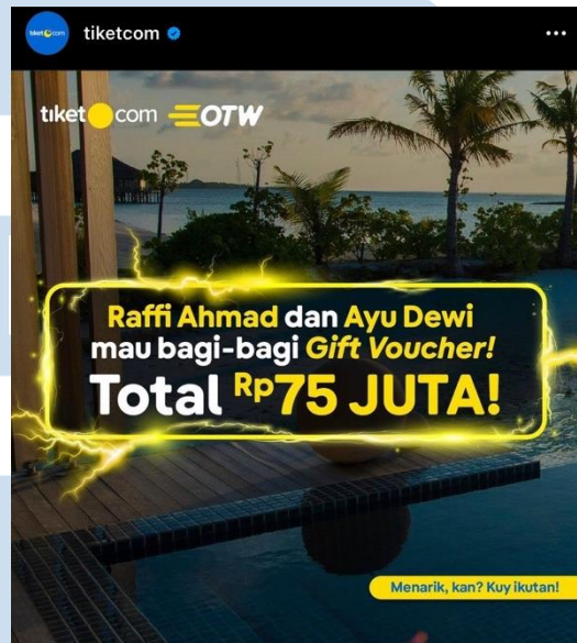
Gambar 2.3 Giveaway Gift Voucher

juga bekerja sama dengan Raffi Ahmad dan Ayu Dewi untuk mengait pangsa pasar dari audiens kedua selebriti tersebut.