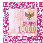
(Laras Ayu Az-Zahra)