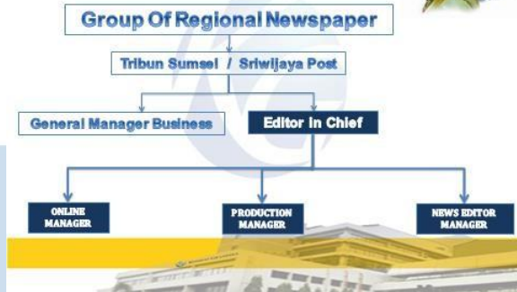
Gambar 2.2 Editor Team