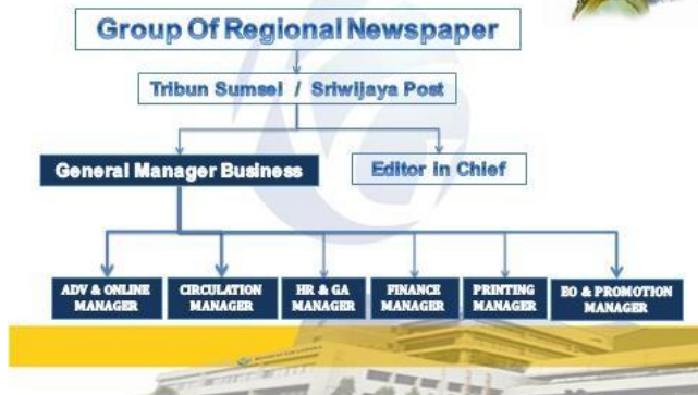
Gambar 2.3 Business Team