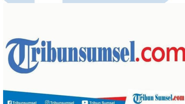
Gambar 2.4 Logo Tribun Sumsel