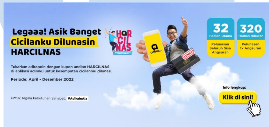
Gambar 2.5 Promosi Harcilnas 2022

Hari Cicilan Lunas (Harcilnas) adalah program undian berhadiah untuk para konsumen Adira Finance yang aktif dengan cara menukarkan adirapoin menjadi kupon undian. Terdapat dua hadiah dalam program Harcilnas ini, yaitu hadiah utama yang berupa pelunasan seluruh sisa angsuran untuk 32 orang pemenang dan hadiah hiburan berupa pelunasan satu kali angsuran untuk 320 orang pemenang.