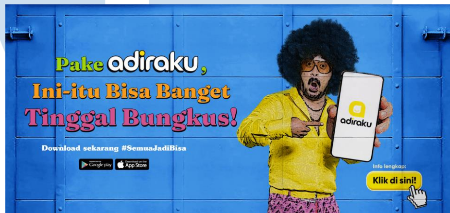
Gambar 2.7 Promosi Peluncuran Aplikasi Adiraku

Adiraku adalah aplikasi yang merangkum semua produk Adira Finance ke. Melalui aplikasi ini, konsumen lebih mudah untuk memantau informasi-informasi pembiayaan konsumen, seperti jumlah sisa angsuran, tanggal jatuh tempo, jejak aktivitas pembiayaan konsumen. Dengan aplikasi ini, konsumen lebih dimudahkan dalam membayar angsuran dengan aman dan tanpa dibebani biaya transaksi. Bahkan, konsumen juga bisa mendapatkan berbagai cashback dan Adirapoin yang dapat digunakan untuk keuntungan lainnya.