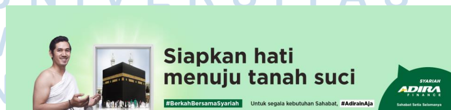
Gambar 2.6 Promosi Pembiayaan Syariah Umrah