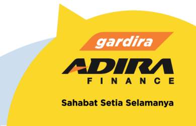
Gambar 2.2 Logo Gardira Adira Finance

Para karyawan yang bekerja di bawah perusahaan Adira Finance memiliki panggilan khusus, yaitu Gardira. Untuk para Gardira, tidak jarang Adira memberikan keuntungan tersendiri, mulai dari promosi-promosi produk tertentu hingga adanya beberapa acara tertentu. Untuk memperakrab interaksi para Gardira, perusahaan menerapkan budaya "Salam sahabat" di mana para Gardira perlu memberi salam dengan ucapan "Salam sahabat" satu sama lain dan kepada konsumen.