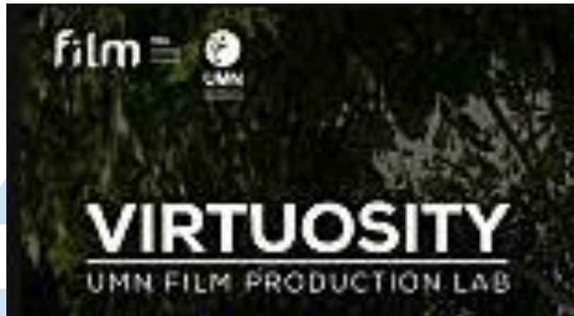
Gambar 2. 2 Logo Virtuosity UMN Film Production Lab