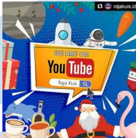
Gambar 2.6 Raja Quiz Anoman

Anoman Studio tidak hanya mengerjakan game, Anoman Studio juga mengerjakan video animasi yang diantaranya adalah raja kuis dan math adventure ( ongoing ). Raja kuis adalah bentuk kolaborasi Anoman Studio dan Helmy Yahya berupa channel Youtube dengan konten mengenai fakta-fakta unik dan menarik dari belahan dunia. Sedangkan Math Adventure adalah proyek yang berfokus pada konten edukasi matematika untuk anak dengan tingkat Sekolah Dasar.