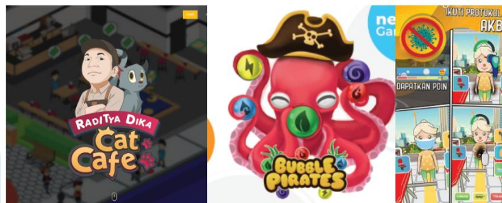
Gambar 2.5 Game 2D lainnya

game lain yang dikembangkan oleh Studio Anoman adalah mobile games Mahabarat Warriors. Game Mahabarat Warriors adalah game Tower Defense yang berdasar pada kisah epik Mahabarata dimana permainan akan menggunakan tokoh-tokoh pandawa yang berusaha melawan kurawa. Game bersistem turn based dan menggunakan sistem gacha seperti RPG smartphone pada umumnya.