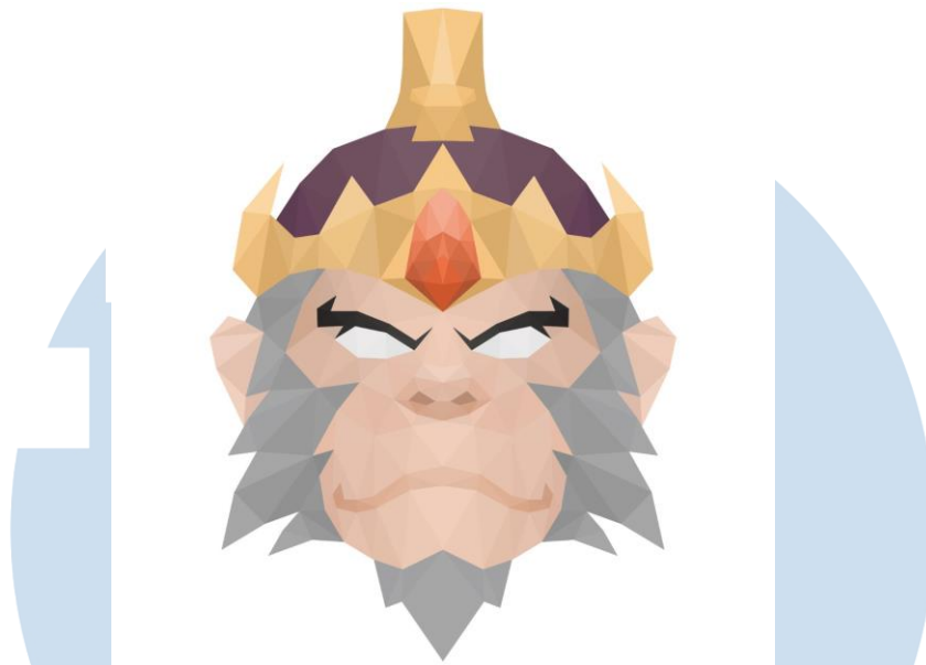
Gambar 2.1 Logo Anoman Studio

Wira (2021), mengatakan bahwa nama Anoman diambil dari tokoh inkarnasi dewa Siwa dan teman perjalanan Rama dalam menemukan Sita, yaitu Hanoman/Anoman/Hanuman. Dalam kisahnya, Hanoman adalah karakter yang berkekuatan dahsyat namun memiliki watak yang jenaka. Oleh karena itu, Anoman Studio diharapkan tetap menjadi tempat yang menyenangkan dalam bekerja, namun tetap kuat menjaga solidaritas antar kolega. Terkhusus dalam pengembangan industry game di Indonesia.