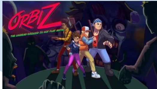
Gambar 2.3 Game Orbiz

Anoman Studio sendiri telah menghasilkan banyak game desktop ataupun mobil. Diantaranya adalah Orbiz, game yang memenangkan penghargaan sebagai PC & Console Game of The Year pada tahun 2017. Game Orbiz juga telah memenuhi kriteria untuk dimasukkan kedalam platform jual beli game internasional Steam sebagai game berbayar. Game orbiz adalah game shooter platformer yang misinya dalah membunuh zombie yang tersebar di seluruh dunia. Gamenya dibagi menjadi beberapa stage, yang setiap stagenya semakin susah untuk diselesaikan. Game obriz juga dapat dimainkan sendiri maupun multiplayer online co-op dan local co-op.