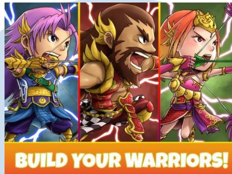
Gambar 2.4 Mahabarat Warriors Anoman Game

game lain yang dikembangkan oleh Studio Anoman adalah mobile games Mahabarat Warriors. Game Mahabarat Warriors adalah game Tower Defense yang berdasar pada kisah epik Mahabarata dimana permainan akan menggunakan tokoh-tokoh pandawa yang berusaha melawan kurawa. Game bersistem turn based dan menggunakan sistem gacha seperti RPG smartphone pada umumnya.