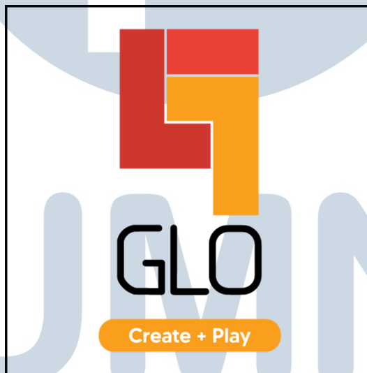
Gambar 2.1. Logo Game Level One.

PT GLO Lintas Orbit didirikan pada tahun 2012. PT GLO Lintas Orbit ini pada dasarnya bertujuan untuk membuat media edukasi melalui video game[1]. Setelah berjalannya waktu, PT GLO Lintas Orbit ini melahirkan Game Level One dengan tujuan untuk bisa lebih menfokuskan kedalam developoing game dimana PT GLO Lintas Orbit dapat berfokus pada publishing . Dengan demikian, PT GLO Lintas Orbit menjadi publisher dan developer game dengan nama Game Level One. Game Level One sekarang beroperasi sebagai developer game yang berfokus pada branding , promoting dan advertising produk menggunakan game sebagai sarana mediana[1].