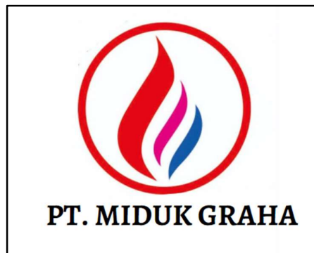
Gambar 2.1 Logo Perusahaan PT. Miduk Graha

PT. Miduk Graha merupakan keagenan/mitra distributor gas resmi elpiji NPSO PT. Pertamina yang didirikan pada tahun 1996. Perusahaan ini sendiri bergerak di industri MIGAS (Minyak dan Gas) yang berfokus pada layanan penjualan Business to Business (B2B) , layanan penjualan Business to Customer (B2C) , proses pelayanan purna jual dan penghubung layanan Customer Relation Management (CRM) antara PT. Pertamina dengan masyarakat. PT. Miduk Graha selalu berkomitmen untuk menyediakan layanan terbaik dalam melaksanakan segala aktivitas proses bisnis baik di bidang penjualan energi dan minyak maupun di bidang retail.