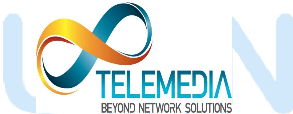
Gambar 2.1 Logo PT. Telemedia Mitra Erajaya

PT. Telemedia Mitra Erajaya adalah perusahaan yang bergerak di bidang telekomunikasi sebagai penyedia solusi total untuk Test and Measurement Network Monitoring dan Telecom Professional Service . PT. Telemedia Mitra Erajaya berdiri sejak tahun 2001 dan berperan sebagai Anritsu Sole Agent and development partner di Indonesia. Pada tahun 2003, PT. Telemedia Mitra Erajaya melakukan perjanjian dengan salah satu operator telekomunikasi terbesar di Indonesia untuk melakukan ekspansi ke pasar nasional. Dari tahun 2007 sampai dengan sekarang, kekuatan terbesar dari PT. Telemedia Mitra Erajaya adalah signaling . PT. Telemedia Mitra Erajaya juga menawarkan operaturus (outsourcing) dan solusi yang memenuhi teknis, implementasi dan operasi permintaan dari customer untuk membuat integrated project yang kompleks dan hemat biaya untuk memenuhi operasi sehari-hari dan permintaan bisnis.