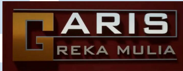
Gambar 2. 1 Logo PT Garis Reka Mulia

Company profile adalah produk tulisan praktisi pekerjaan rumah yang berisi gambaran umum perusahaan [5]. Gambar 2.1 diatas merupakan logo dari perusahaan PT. Garis Reka Mulia yang merupakan perusahaan korporat kontraktor independen multidisiplin yang memberikan layanan jasa proyek konstruksi yang berkantor pusat di BSD City, Tangerang Selatan, Indonesia. PT Garis Reka Mulia didukung oleh tenaga ahli dan profesional yang matang dan berpengalaman dalam menentukan pekerjaan di bidang struktur, perencanaan, desain, arsitektur, mekanikal elektrik, manajemen proyek dan konstruksi hingga selesai. PT Garis Reka Mulia lengkap untuk layanan profesional untuk klien sektor swasta dan publik. Reputasi kami untuk keunggulan dan kreativitas dari motto kami “ Archive, Safe and Harmony ” dengan demikian, kami menawarkan jasa kepada klien perencanaan visioner, desain inovatif, rekayasa kualitas tinggi dan manajemen. Semuanya dalam layanan di bawah satu atap, proses lancar dan mulus.