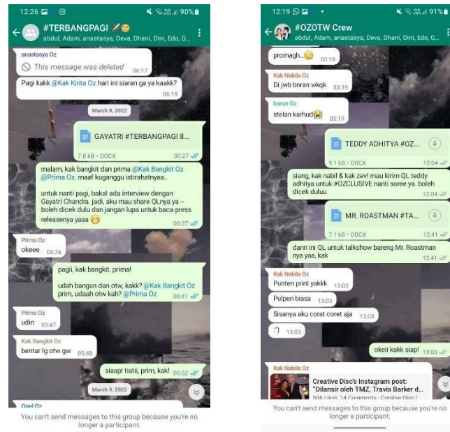
Gambar 3.5 Bentuk koordinasi yang penulis lakukan pada obrolan grup WhatsApp

yang dipromosikan. Selain itu, penulis juga mengulik latar belakang atau hal lainnya yang bersangkutan dengan artis tersebut melalui media sosial untuk lebih mengenal saat awal talkshow .