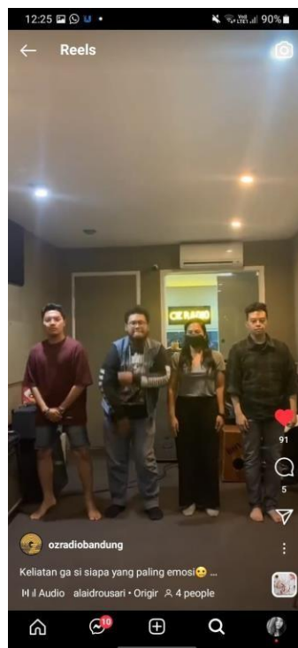
Gambar 3.3 Salah satu konten yang penulis terlibat di Instagram OZ Radio Bandung

Sebagai asisten produser, penulis memiliki tugas untuk mengatur kelancaran setiap program prime time yang disiarkan secara on-air , mulai dari menyiapkan materi siaran, naskah, menulis adlibs dan spot iklan dari sebuah produk, menyiapkan konten untuk mengisi media sosial Instagram OZ Radio Bandung. Selama proses praktik kerja magang di OZ Radio Bandung, penulis bertanggung jawab atas segala materi yang dibawakan oleh penyiar, baik untuk program Terbang Pagi dan OZ OTW . Hal ini tentu dibantu juga oleh anak magang lain yang melakukan praktik kerja bersama.