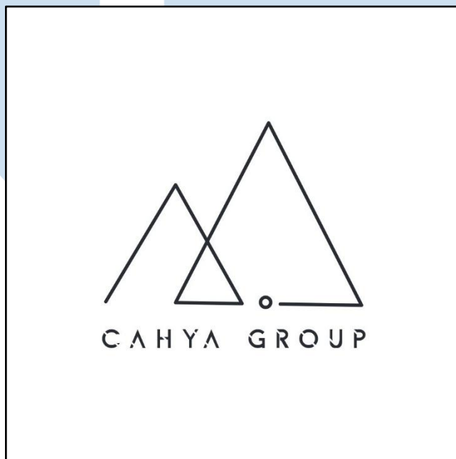
Gambar 2.1 Logo Perusahaan PT. CAHYA PROPERTY GROUP