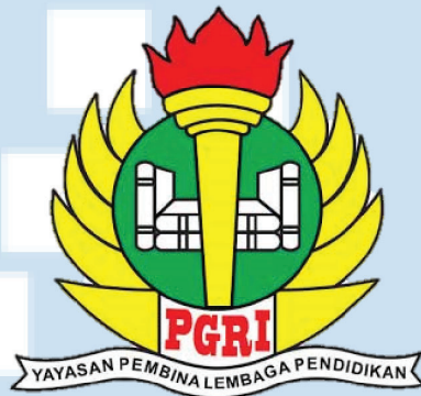
Gambar 2.1 Logo PGRI

Gambar 2.1 Logo PGRI diatas merupakan logo yang digunakan setiap sekolah PGRI yang merupakan inisiatif dari PGRI. PGRI ini membangun pendidikan swasta di tingkat Sekolah Dasar (SD), Sekolah Menengah Pertama (SMP) dan Sekolah Menengah Pertama (SMA) atau sederajat. Salah satu nya adalah SMP PGRI 396 yang berlokasi di Jl. Raya Perumnas Bumi Kelapa Dua, Kelapa Dua, Tangerang, Banten. SMP PGRI 396 ini berdiri sejak 1988 hingga saat ini dan memiliki akreditasi A, dengan memiliki tenaga pendidik sebanyak 13 orang, siswa sebanyak 299 orang dan memiliki 9 ruang belajar.