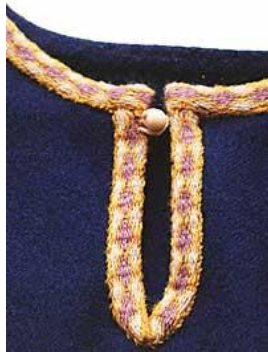
Gambar 3.2. Anyaman pada Tunik Leher

( http://www.hurstwic.org/history/articles/daily_living/pix/braid.jpg )