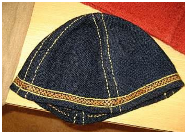
Gambar 3.12. Topi Viking

Hurstwic (n.d.) mengatakan bahwa topi bagi Viking dibuat dari bahan wool, kulit domba atau kulit hewan lainnya, atau bulu binatang. Beberapa memiliki penutup telinga untuk memberikan kehangatan. Polanya terbuat dari beberapa bagian yang berbentuk segitiga dan kemudian dijahit menjadi satu. Ada pula bentuk lain seperti hood khususnya untuk musim salju. Hood ini disebut dengan istilah hottr , yang menutupi kepala sampai ke bagian bahu, seperti yang digunakan pada periode Medieval selanjutnya.