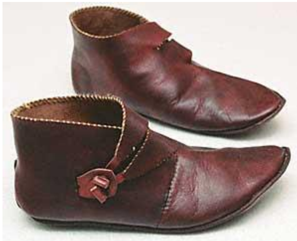
Gambar 3.18. Sepatu dengan Toggles

ada tipe sepatu yang ditemukan di daerah Inggris yang memiliki toggles sebagai pengait. Sepatu jenis ini lebih rumit untuk dibuat. Bagian belakang solnya memanjang hingga keatas karena diduga untuk menghindari kerusakan yang mudah terjadi ketika pemakaian. Bagian pinggir lubang kakinya juga dijahit dengan benang yang berbeda warna dengan sepatunya.