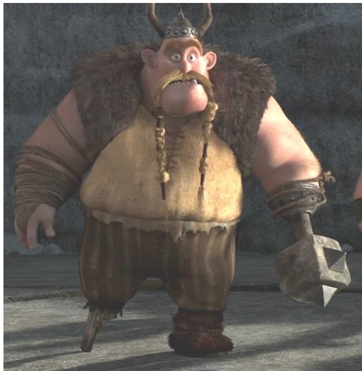
Gambar 3.32. Pakaian Gobber (How To Train Your Dragon, 2010)

memiliki ujung dari besi yang berbentuk setengah bola dengan paku-paku besi. Besi ini diikat dengan tali tambang sebagai pengikat kepada tangan aslinya. Di bagian tengahnya berlubang dan Gobber memasukkan peralatan yang berbeda-beda sesuai kebutuhannya. Sepanjang film, penulis mendapati bahwa ada 6 peralatan yang digunakan Gobber sebagai pengganti tangannya. Benda-benda tersebut adalah kapak dua sisi, palu pandai besi, palu perang, penusuk, penjepit, dan kait. Selain itu Gobber juga mengenakan helm dengan sepasang tanduk yang tinggi ke atas dan juga beberapa tali untuk mengikat kumisnya.