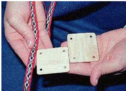
Gambar 3.3. Weaving Tablet

( http://www.hurstwic.org/history/articles/daily_living/pix/braid.jpg )