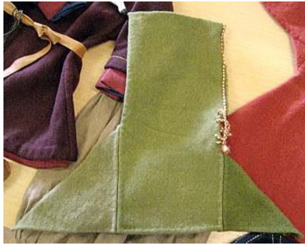
Gambar 3.13. Hood