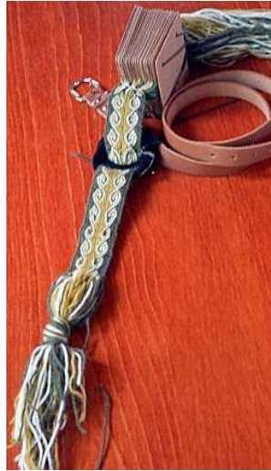
Gambar 3.5. Hasil Anyaman Weaving Tablet