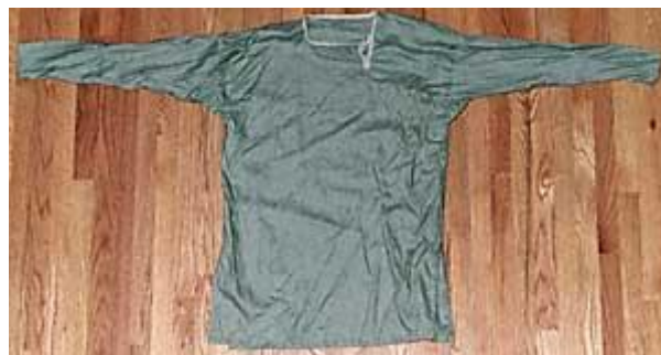
Gambar 3.6. Baju Dalam

Di dalam tunik, para pria juga menggunakan baju dalam yang terbuat dari linen. Bahan ini lebih mahal daripada wol tetapi lebih nyaman bila bersentuhan dengan kulit. Pola baju dalam ini sama dengan tunik luarnya hanya saja dibuat lebih panjang baik bagian bawah maupun lengannya. Menurut Hurstwic (n.d.) hal ini diduga dilakukan untuk menunjukkan kekayaan sang pemilik dengan menyatakan bahwa ia mampu memiliki baju dalam. Baju dalam ini digunakan sebagai pakaian tidur dengan melepas tunik wol luar ketika hendak tidur. Masyarakat dengan kelas sosial budak tidak memiliki pakaian ini dan tidur tanpa pakaian.