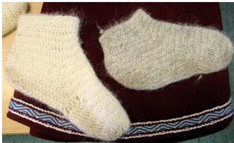
Gambar 3.15. Kaus Kaki Wol dengan Teknik Needle Binding

( http://www.hurstwic.org/history/articles/daily_living/pix/nalbinding_sketch.jpg )