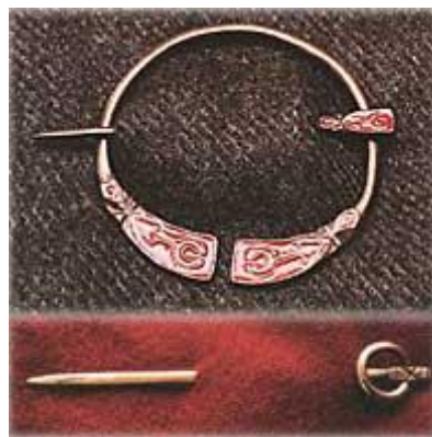
Gambar 3.10. Penannular Brooch