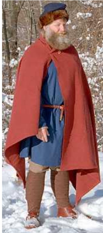
Gambar 3.9. Jubah

dihias dengan ornamen seperti umumnya perhiasan dari daerah Eropa Utara. Selain jubah, jaket dan mantel wol juga digunakan pada masa ini.