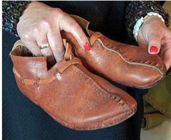
Gambar 3.17. Contoh Replika Sepatu Viking

( http://www.hurstwic.org/history/articles/daily_living/pix/turnshoe_sketch.gif )