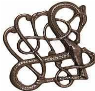
Gambar 3.29. Hiasan Perak dengan Tipe Urnes

Keenam dan terakhir adalah tipe Urnes. Tipe ini berlangsung dari pertengahan abad ke 11 hingga ke abad 12. Merupakan tipe terakhir dari Norse Art . Motif yang digunakan adalah binatang yang telah disederhanakan bentuk dengan cukup ekstrim sehingga menghasilkan badan yang dipanjangkan. Memiliki ciri khas bentuk angka 8 dan jumlah loopnya sangat banyak.