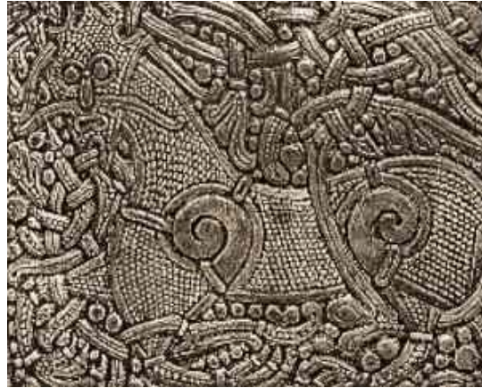
Gambar 3.27. Hiasan Tipe Mammen pada Tutup Peti Mati

buah motif utama dibingkai dengan hiasan gulungan yang tidak simetris atau garis-garis ornamental.