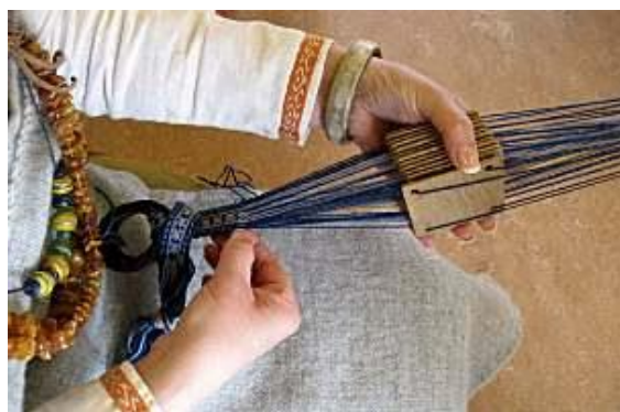
Gambar 3.4. Cara Penggunaan Weaving Tablet

( http://www.hurstwic.org/history/articles/daily_living/pix/tablet_weaving_tablets_and_braid.jpg )