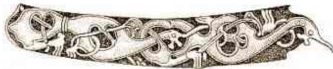
Gambar 3.24. Ukiran yang Ditemukan pada Kapal Oseberg

Pertama adalah motif Oseberg. Tipe ini digunakan selama tiga perempat abad ke -9. Dikenal karena motifnya yang bernama gripping-beast .