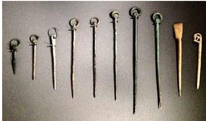
Gambar 3.11. Beberapa Contoh Material Pin

( http://www.hurstwic.org/history/articles/daily_living/pix/cloak_pins.jpg )