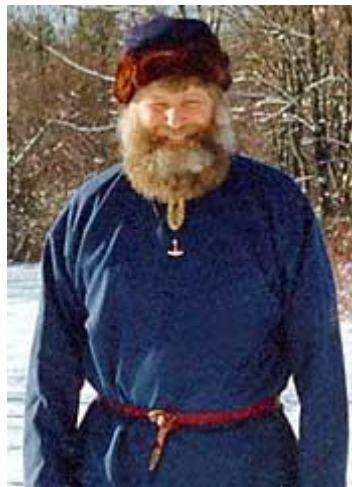
Gambar 3.22. Sabuk yang Disimpulkan

sabuk dan dibiarkan menggantung. Bagian ujung sabuk yang menggantung dihias dengan lempengan dekoratif. Tidak hanya ujung, namun buckle sabuk dan juga badan sabuk dihias dengan lempengan dekoratif. Sabuk ini digunakan untuk membawa peralatan karena tunik tidak memiliki kantung. Dua peralatan dasar yang sering digunakan adalah pisau serba guna dan juga kantung kecil yang terbuat dari kulit halus atau kain. Kantung ini digunakan untuk membawa koin, alat untuk menyalakan api, kain untuk membersihkan wajah atau tangan, dan lain-lain. Namun, kunci dibawa dengan dikalungkan pada leher. Senjata seperti pedang pendek atau sax juga dipasang pada sabuk.