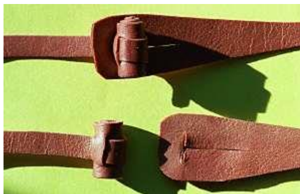
Gambar 3.19. Toggles