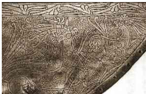
Gambar 3.28. Hiasan Tipe Ringerike

Kelima adalah tipe Ringerike. Tipe ini mulai dari awal abad ke 11 hingga ke pertengahan abad tersebut. Motif hewan menyerupai singa masih dipakai dengan ujung-ujung bulu tengkuk dan ekor yang menggulung. Motif tanaman juga dipakai dengan bentuk-bentuk seperti dedaunan.