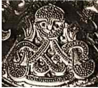
Gambar 3.25. Detil Hiasan Tipe Borre pada Bros Wanita

( http://www.hurstwic.org/history/articles/manufacturing/pix/borre_style.jpg )