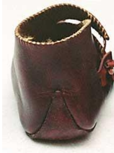
Gambar 3.20. Sol Sepatu yang Dipanjangkan

( http://www.hurstwic.org/history/articles/daily_living/pix/shoe_toggle.jpg )