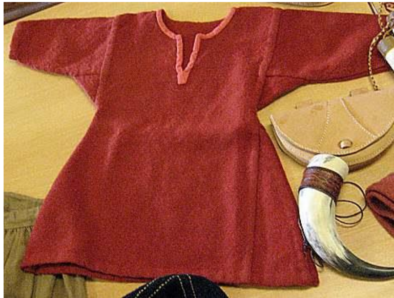
Gambar 3.1. Tunik Pria Viking