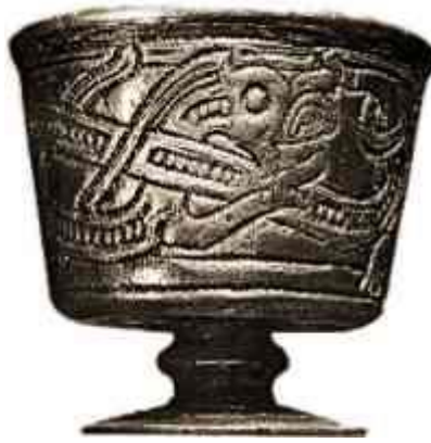
Gambar 3.26. Hiasan Tipe Jelling pada Gelas yang Ditemukan di Jelling-Denmark

Ketiga adalah tipe Jelling. Bukti awal tipe ini yang ditemukan berasal dari masa awal abad 10 dan digunakan sampai tiga perempat abad 10. Tipe ini memiliki ciri khas yaitu ornamen yang membentuk huruf S dengan sumbu simetri yang miring diagonal.