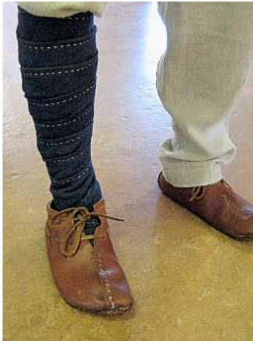
Gambar 3.8. Pembalut Kaki

( http://www.hurstwic.org/history/articles/daily_living/pix/leg_wraps.jpg )