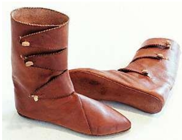
Gambar 3.21. High Shoes

( http://www.hurstwic.org/history/articles/daily_living/pix/shoe_toggle.jpg )