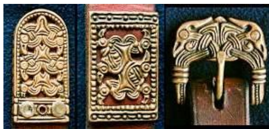
Gambar 3.23. Hiasan Dekoratif Sabuk

( http://www.hurstwic.org/history/articles/daily_living/pix/belt_knot.jpg )