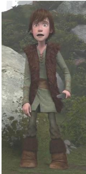
Gambar 3.30. Pakaian Lengkap Hiccup (How To Train Your Dragon, 2010)

dan panjang serta pas mengikuti bentuk kakinya hingga masuk ke dalam sepatu botnya. Sepatu botnya terbuat dari kulit dengan warna cokelat yang bagian atasnya memiliki bulu dengan warna lebih gelap dibanding sepatunya. Hiccup sempat menggunakan helm besi bertanduk di kedua sisinya pada adegan tertentu pada film. Ia memperolehnya di tengah film dari ayahnya sebagai hadiah dan ia memakainya ketika bertarung melawan naga Monstrous Nightmare di depan seluruh kaum Viking.