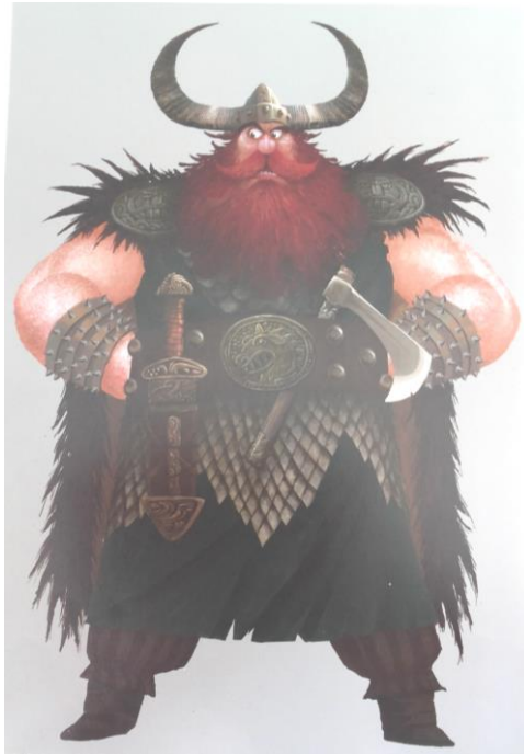
Gambar 3.31. Pakaian Stoick

(The Art of DreamWorks How To Train Your Dragon, 2010)