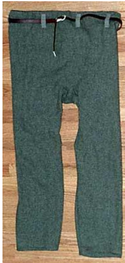
Gambar 3.7. Celana Viking

Hurstwic (n.d.) menjelaskan bahwa sebagian besar penduduk Eropa Utara menggunakan celana panjang dalam berbagai jenis. Ada yang ketat maupun longgar, panjang sampai menutupi kaki atau hanya sampai pergelangan. Namun, semuanya memiliki bentuk yang simpel dan tidak memiliki kantung saku maupun celah tambahan seperti resleting pada jaman modern. Karena hal ini, lubang celana dibuat sangat besar untuk bisa cukup untuk melewati bagian pinggul. Dari peninggalan yang berhasil ditemukan, celana ini memiliki lubang untuk sabuk, dengan demikian dapat diasumsikan bahwa celana ini menggunakan sabuk untuk menahan letaknya di bagian pinggang.