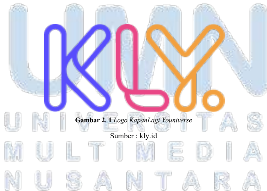
Gambar 2.1 Logo KapanLagi Youniverse