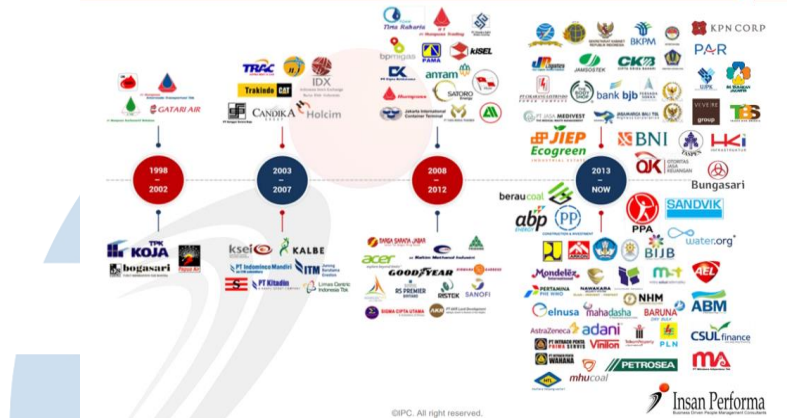
Gambar 2. 2 Client Insan Performa

Selama lebih dari 24 tahun berdiri PT Insan Performa telah melayani klien perusahaan swasta hingga badan usaha milik negara seperti Trakindo Utama, Pertamina Persero, Direktorat Jendral Pajak, Bank Indonesia, Nirwana Garden Resort, dan Puri Dibya Property (Margocity Mall). Saat ini PT Insan Performa sedang berfokus dalam pelayanan dalam pengembangan konsulting secara online untuk mendukung proses bisnis pelanggannya.