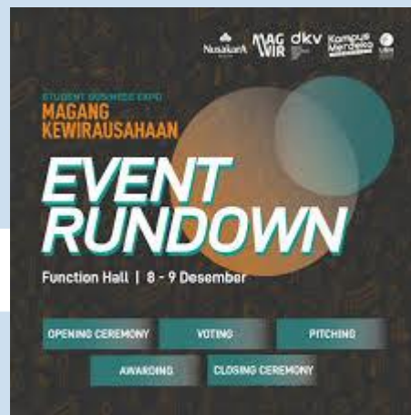
Gambar 1.1 Magang Kewirausahaan