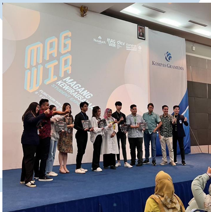
Gambar 1.2 Penyerahan Plakat Pemenang Ide Bisnis Pada Program Magwir

Penulis memilih magang kewirausahaan karena penulis memiliki ketertarikan dalam bidang bisnis dan program magang wirausaha ini membantu mahasiswanya untuk lebih mengembangkan bisnisnya lebih matang lagi. Disisi lain magang wirausaha ini dapat dijadikan standar nilai untuk lulus dari program magang pada Universitas Multimedia Nusantara. Pada saat ini penulis sudah memiliki bisnis namun ingin dikembangkan lebih lagi sehingga hal ini menjadi alasan untuk penulis memilih magang kewirausahaan yang dimana searah dengan tujuan dari penulis.