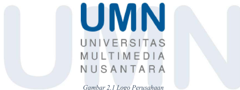
Gambar 2.1 Logo Perusahaan