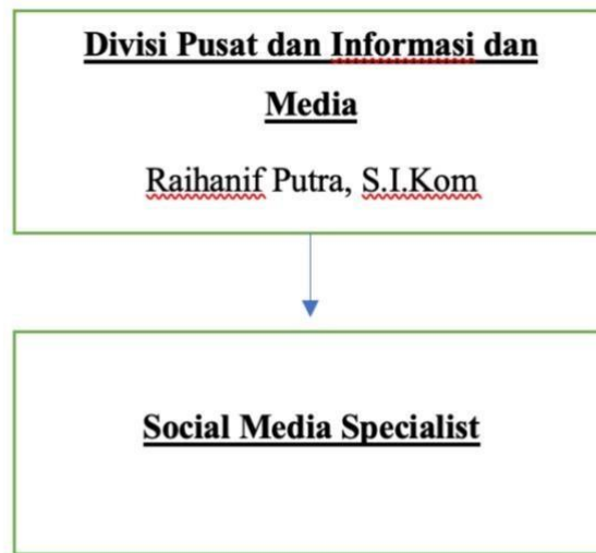
Gambar 2. 3 Struktur Divisi Pusat dan Informasi dan Media