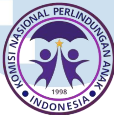
Gambar 2. 1 Logo Komnas Anak

Komnas Anak memiliki arti logo sebagai berikut: