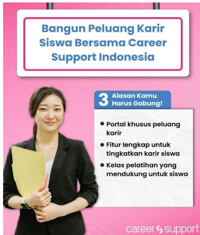
Gambar 1. 2 Career Support

Untuk pusat karir di perguruan tinggi serta sekolah kejuruan, Career Support berperean dalam mengoptimalkan kinerja pusat karir dengan merujuk siswa serta lulusannya ke Lembaga bisnis berstrategi digital yang lebih efektif. Tidak hanya menjadi solusi yang bisa digunakan oleh siswa serta institusi pendidikan, Career Support juga bisa mempermudah sejumlah bisnis memperoleh lulusan baru serta magang terbaik dari institusi pendidikan dengan lebih mudah. Di Career Support, bisnis dapat memperoleh serta mencari fresh graduate serta peserta magang guna mengisi sejumlah posisi, antara lain marketing, teknologi informasi, teknik, accounting and finance serta bidang yang lain.