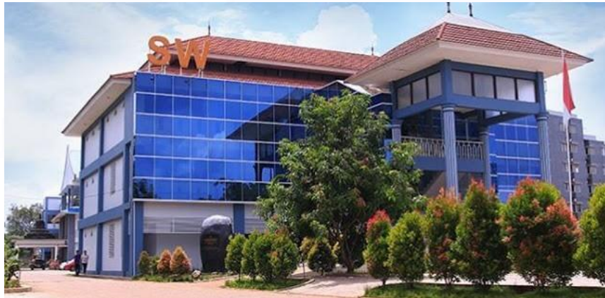
Gambar 2. 1. Gedung Kampus STABN Sriwijaya

Gambar 2.1. Merupakan foto tampak bagian depan gedung Kampus STABN Sriwijaya Tangerang.