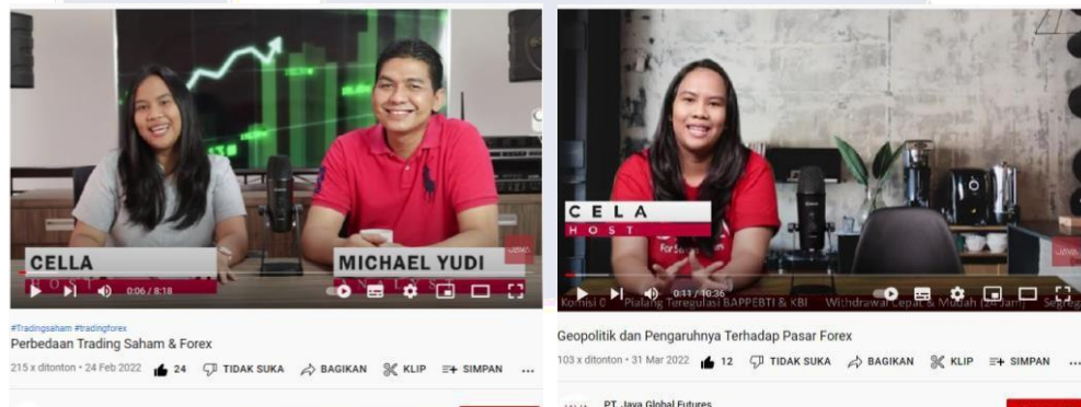
Gambar 3.7 Video Podcast Youtube