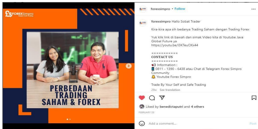
Gambar 3.5 Design Feed Instagram