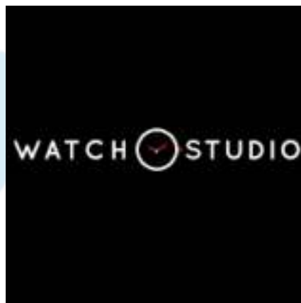
Gambar 2.1 Logo Watch Studio