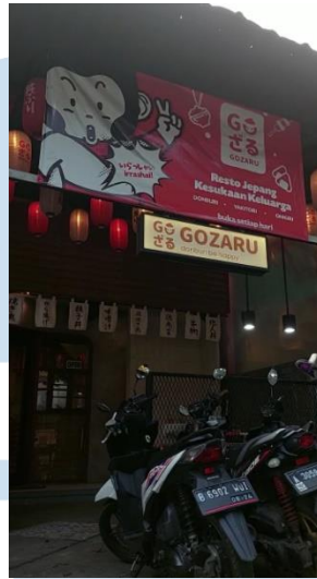
Gambar 2.3 Lokasi Gozaru Resto Bintaro