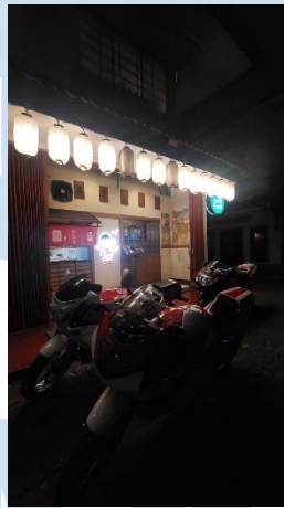
Gambar 2.2 Lokasi Gozaru Resto BSD

PT Mangkok Besar Cuan sendiri memiliki lokasi di dua tempat, untuk alamat pusatnya, PT Mangkok Besar Cuan berlokasi di Jl. Letnan Sutopo No.11, Lengkong Gudang Tim. Kec. Serpong, Kota Tangerang Selatan, dan untuk tempat lainnya terletak di Jl. Elang Blok HF I No.9, Kota Tangerang Selatan.