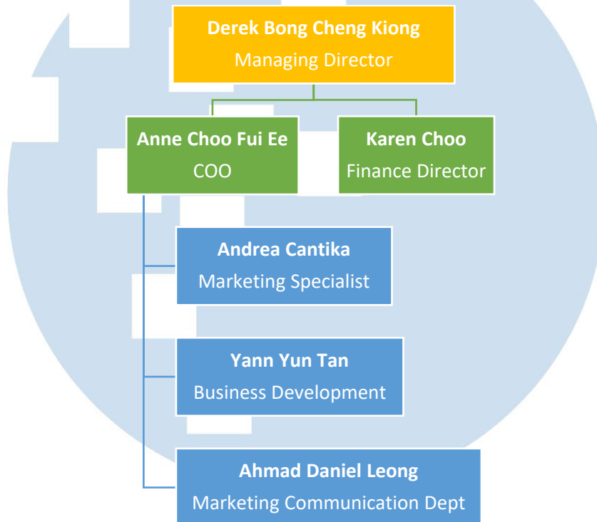
Gambar 2. 2 Struktur Organisasi BIGIT Sdn Bhd

Struktur organisasi BIGIT Sdn Bhd adalah sebagai berikut;