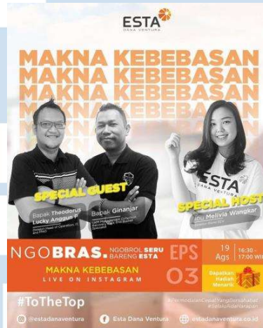
Gambar 3. 13 konten Live EDV NGOBRAS EPS 03.

Pada bagian penutup talkshow terdapat giveaway , host memberikan pertanyaan “apa makna kebebasan menurut versimu?” penonton dapat menjawab melalui kolom komentar konten Live EDV NGOBRAS EPS 03. Penonton akan mendapatkan Rp20.000 bagi 5 orang pemenang bagi jawaban yang paling menginspirasi.