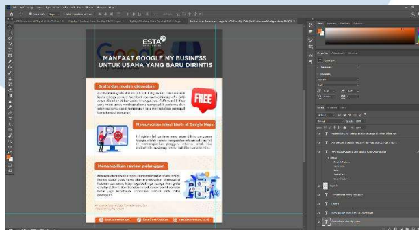
Gambar 3. 4 Proses Desain Konten Interaktif Instagram