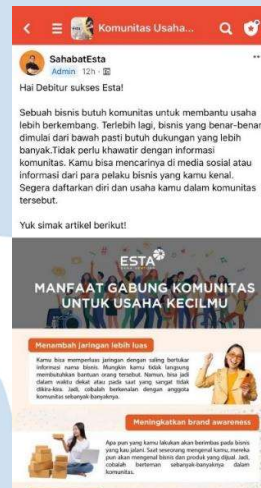
Gambar 3. 8 Caption Post Instagram