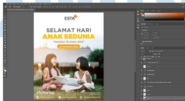
Gambar 3. 5 Proses Desain Konten Artikel Facebook