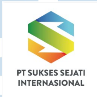
Gambar 2.1. Logo Perusahaan