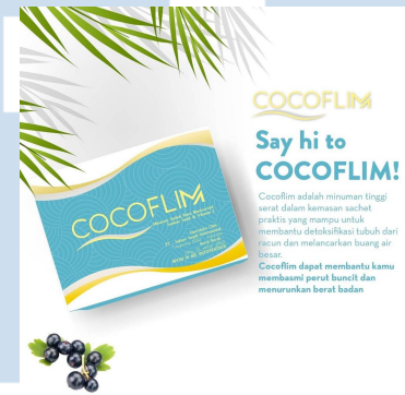
Gambar 2.4 Box Cocoflim

Cocoflim merupakan produk serat kedua dari PT. SSI yang diproduksi pada tahun 2022. Produk ini adalah minuman serbuk rasa bluberi yang berfungsi melancarkan pencernaan.