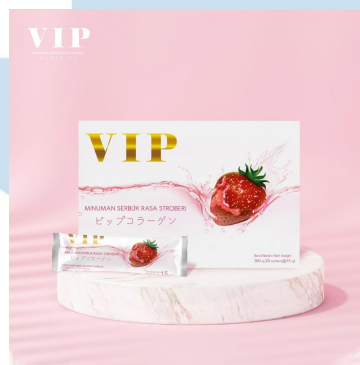
Gambar 2.3 Box VIP Collagen

VIP Collagen adalah produk kecantikan pertama dari PT. SSI yang diproduksi dari 2021 hingga saat ini. VIP Collagen berfungsi untuk menjaga kesehatan kulit. Saat ini brand VIP baru memiliki satu varian rasa yaitu rasa stroberi. Kedepannya akan muncul berbagai varian rasa dengan fungsi yang tentunya berbeda juga.