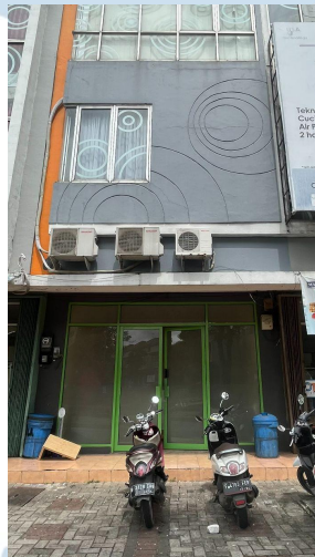
Gambar 2.2. Kantor PT. SSI