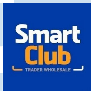
Gambar 2. 6 Logo SmartClub

“SmartClub memiliki konsep One Stop Buying , dimana seluruh kebutuhan pelanggan dapat terpenuhi di dalam suatu tempat untuk menghemat waktu. Seluruh produk tersedia di bawah satu atap mulai dari produk segar, makanan dan minuman kemasan, elektronik, segala keperluan rumah tangga, hingga alat tulis kantor”.