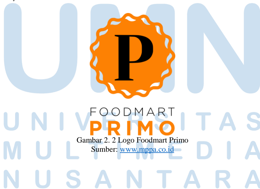
Gambar 2. 2 Logo Foodmart Primo

“Kemudian untuk Foodmart Primo sebagai format supermarket premium bagi pelanggan kelas atas, menawarkan berbagai produk internasional, beragam produk segar berkualitas serta area ready-to-eat (RTE) yang lebih luas dengan menyediakan santapan, baik untuk disantap langsung atau dibawa pulang, serta kafe dan bakery ”.