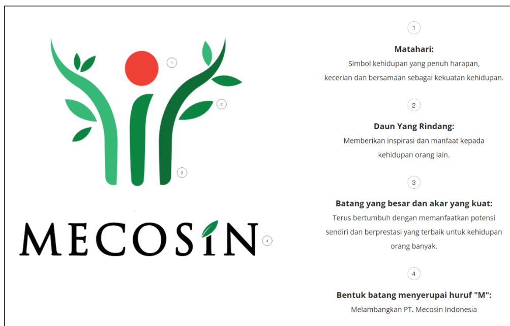
Gambar 2. 1 Logo Perusahaan PT Mecosin Indonesia Beserta Definisi

PT Mecosin Indonesia adalah perusahaan swasta yang secara resmi didirikan pada tahun 1960 di Bandung, Indonesia dengan nama Medicinal and Cosmetic Industries yang disingkat menjadi PT Mecosin Indonesia. PT Mecosin Indonesia bergerak di bidang industri produk kesehatan berkualitas, beberapa produk kesehatan yang diproduksi adalah obat tradisional, obat OTC, dan obat Ethical. Salah satu produk PT Mecosin Indonesia yang telah lama dikenal dan digunakan oleh masyarakat Indonesia adalah Laserin. Saat ini, PT Mecosin Indonesia dipimpin oleh 2 pengusaha hebat yaitu Ibu Yurita Tjahaja ( President Director ) bersama Bapak Budi Hermawan ( Operational Director ).