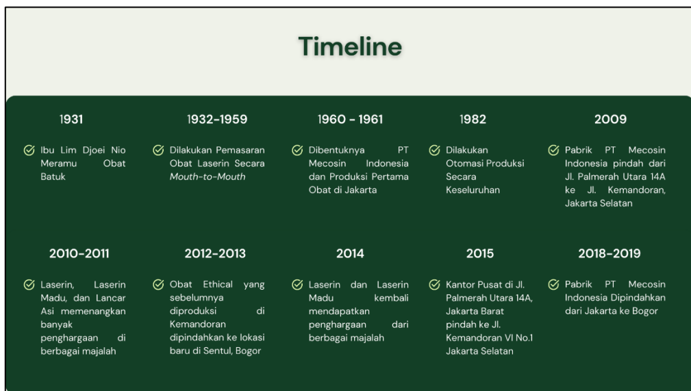
Gambar 2. 2 Timeline Proses Pembentukan PT Mecosin Indonesia

Berdasarkan informasi yang tertulis pada situs resmi PT Mecosin Indonesia [6], berikut ini adalah timeline yang menggambarkan secara garis besar proses pembentukan dari PT Mecosin Indonesia.