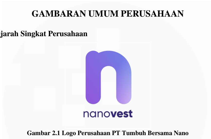
Gambar 2.1 Logo Perusahaan PT Tumbuh Bersama Nano

Gambar 2.1 merupakan logo perusahaan PT Tumbuh Bersama Nano. PT Tumbuh Bersama Nano atau yang lebih sering dikenal dengan Nanovest berdiri pada tahun 2021. Nanovest merupakan salah satu perusahaan yang bergerak di bidang platform investasi yang berada di bawah naungan Sinarmas. Potensi perkembangan pada pasar investasi di Indonesia yang terus meningkat melatarbelakangi berdirinya Nanovest di dunia investasi. Memasuki era investasi crypto , Nanovest memperoleh data bahwa jumlah investor crypto di Indonesia meningkat 2 kali lipat lebih banyak dari tahun 2020 ke tahun 2021. Selain itu, pasar crypto diprediksi akan terus meningkat bahkan mencapai 4,5 kali lipat di tahun 2025.