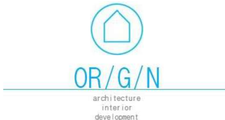
Gambar 2.1 Logo PT. Origin Imaji Indonesia

PT. Origin Imaji Indonesia memiliki visi untuk menyelesaikan proyek dengan skala maupun tingkat kompleksitas yang beragam. Sedangkan misi yang dicapai dari perusahaan ini yaitu untuk memberikan karya dengan pengetahuan teknis serta material yang memadai dengan selalu untuk up-to-date teknologi terkini untuk merencanakan karya secara cermat dari sisi estetika, konstruksi dan anggaran biaya agar tercipta karya yang well designed. Dari desain-desain yang dirancang, terdapat sebuah filosofi yang dipegang oleh perusahaan yaitu “We believe the essence of creating form within the spaces lied beneath is balance solid – void , massive – transparent well blended to appear contemporary” .