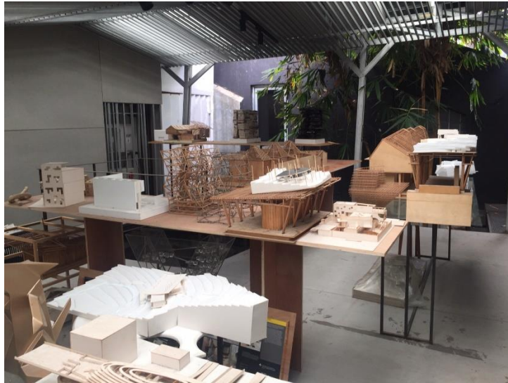
Gambar 2.2 Ruang Maket

Pendekatan proses perancangan lainnya berupa riset. Sebelum proses perancangan dimulai, assistant architect akan melakukan riset mendalam dan menyeluruh mengenai lokasi perancangan. Tidak hanya sebatas untuk analisis tapak, tetapi juga untuk menarik benang merah dari keseluruhan tapak yang dapat dijadikan sebuah konsep perancangan. Sehingga, dasar perancangan yang didapatkan akan sangat kuat dan valid.