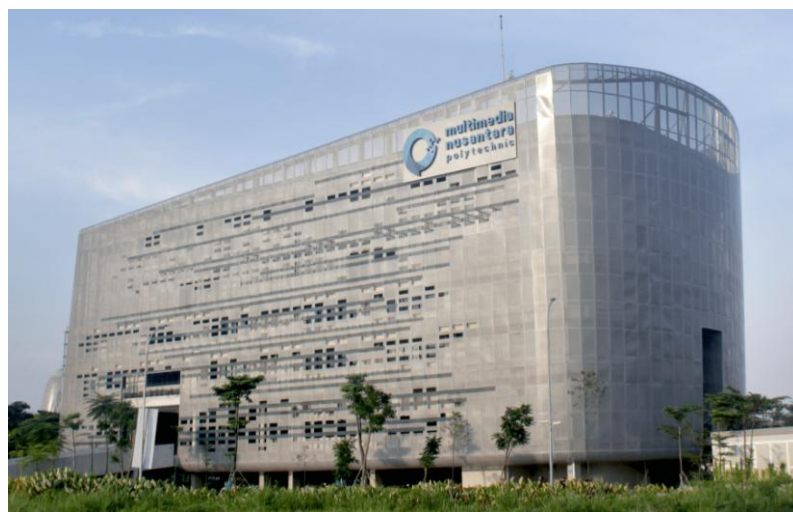
Gambar 2.3 Politeknik Multimedia Nusantara