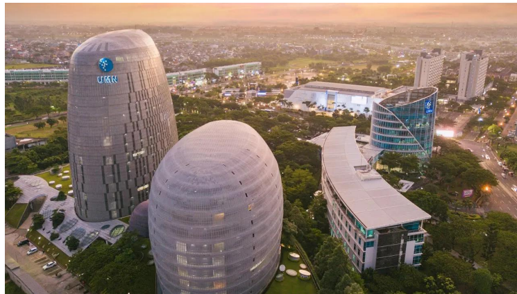
Gambar 2.2 Gedung Universitas Multimedia Nusantara

Universitas Multimedia Nusantara hingga saat ini telah memiliki total 4 gedung dan gedung terbaru telah diresmikan pada tahun 2017. Saat ini, 13 program studi dan 1 program magister telah dimiliki oleh Universitas Multimedia Nusantara. Gedung terbaru Universitas ini diberi nama P.K. Ojong-Jakob Oetama Tower. P.K. Ojong-Jakob Oetama Tower kembali mengandalkan desain pasif, seperti New Media Tower . Selain mengembangkan Universitas, Yayasan Multimedia Nusantara juga mendirikan Politeknik Multimedia Nusantara (PMN) yang kembali di desain ulang oleh DCM Jakarta sehingga PMN tetap menerapkan desain pasif.