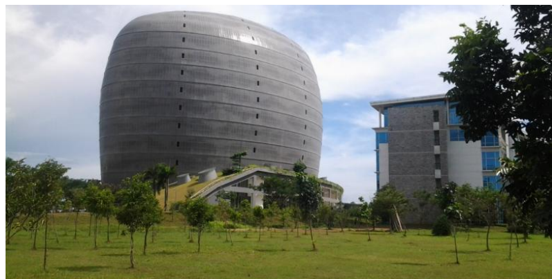
Gambar 2.1 New Media Tower UMN

Universitas Multimedia Nusantara atau UMN berdiri pada tahun 2005, tepatnya tanggal 25 November. UMN disponsori oleh Yayasan Multimedia Nusantara yang didirikan oleh Kompas Gramedia. Pada tanggal 3 September 2007 telah dilaksanakan kuliah perdana UMN tahun pertama (Universitas Multimedia Nusantara, 2019). Pada awal berdirinya, UMN memiliki dua gedung, Gedung A sebagai gedung Rektorat dan Gedung B tempat diadakannya perkuliahan. Kedua gedung tersebut diresmikan oleh Menteri Pendidikan Nasional pada tahun 2009 (Universitas Multimedia Nusantara, 2019). Dari awal berdiri hingga saat ini, UMN terus berkembang. Tahun 2012, Universitas Multimedia Nusantara membuka gedung baru dan nama UMN mulai dikenal. Bangunan tersebut adalah New Media Tower . New Media Tower dirancang oleh firma arsitektur Green Building Concepts DCM Jakarta. The New Media Tower memenangkan ASEAN Energy Awards (2014) untuk Kategori Bangunan Tropis Terbaik (Universitas Multimedia Nusantara, 2019).