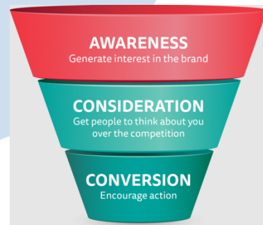
Gambar 2.1 Ilustrasi Sistem Pemasaran Closed-Loop