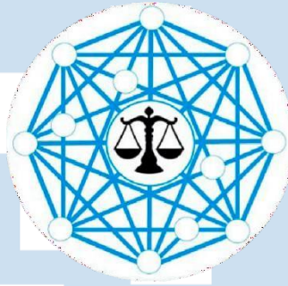
Gambar 2.1. Logo Perusahaan IndoCryptoLaw (IndoCryptoLaw, 2021)