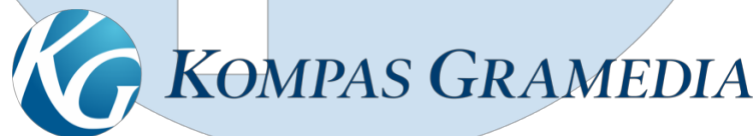
Gambar 2.1 Logo Kompas Gramedia

Kompas Gramedia adalah kelompok usaha yang didirikan tahun 1963 oleh (Alm.) Jakob Oetama dan (Alm.) P.K. Ojong. Kompas Gramedia sudah memiliki lebih dari 200 jaringan perusahaan mulai dari Media, Retail Publishing, Hospitality, Event Venue, dan lainnya. Corporate Human Resources merupakan bagian dari unit organisasi Kompas Gramedia yang bertugas mengembangkan kapabilitas karyawan Kompas Gramedia melalui pelatihan dan pengembangan hard skill dan soft skill . Dengan harapan karyawan tidak hanya berkerja namun menumbuhkan keinginan untuk belajar (Kompas Gramedia, 2019).