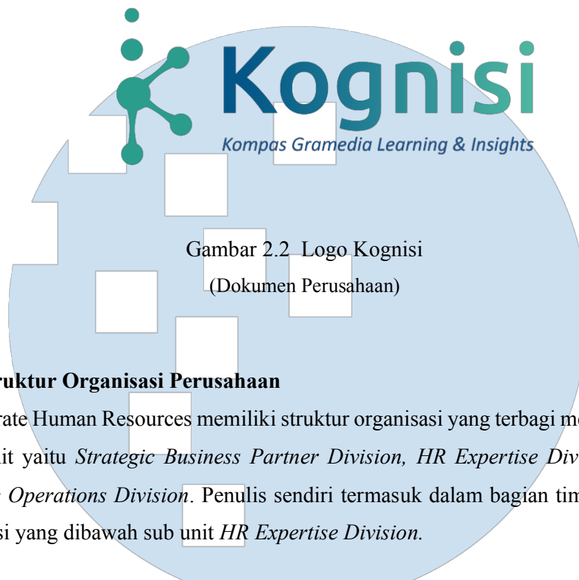
Gambar 2.2 Logo Kognisi (Dokumen Perusahaan)