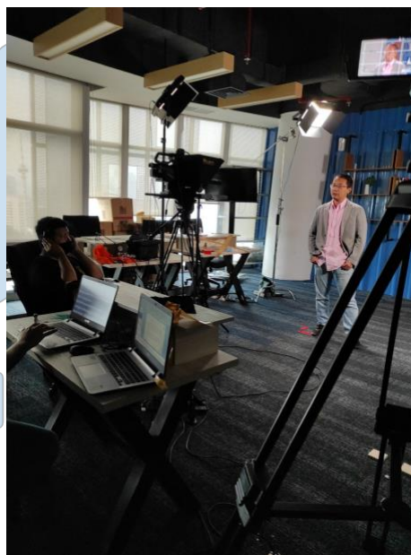
Gambar 3.4 Produksi Course

Sebelum melakukan syuting, Tim yang terlibat memastikan bahwa produksi yang dilakukan sudah melakukan protokol kesehatan yang ketat. Pertama, dilakukannya swab antigen oleh tim lab yang disediakan oleh HR KG keada setiap yang terlibat dalam produksi sebelum memasuki tempat. Kedua, semua yang terlibat wajib memakai masker dan membawa hand sanitizer atau pembersih lainnya. Ketiga, selama pemateri berada didepan kamera dan berbicara maka boleh dilepas masker. Keempat, yang terlibat dalam produksi ini juga harus menjaga jarak dan selalu mencuci tangan.