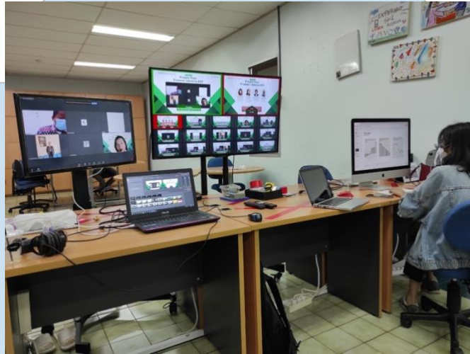
Gambar 3.5 Control Room - Live Streaming Operator (Dokumentasi Pribadi)

dua jalur. Sebelum acara berlangsung, penulis memastikan saat acara persiapan pada teknis dan materi sudah final. Terakhir, eksekusi acara berlangsung dan koordinasi dalam penyelenggaraan sudah berjalan dengan baik.