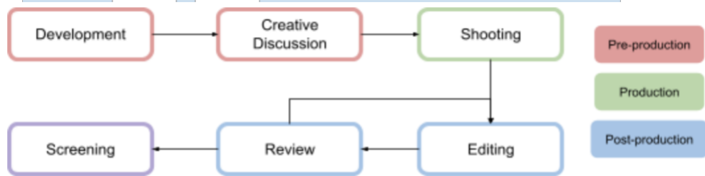
Gambar 3.2 Bagan Proses Produksi Course dan Branding Content (Dokumen Perusahaan)