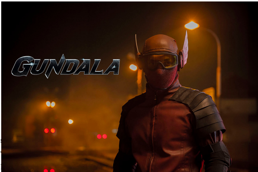
Gambar 2.2 Materi Film Gundala

PT. Screenplay Bumilangit Produksi telah menyelesaikan dan menayangkan salah satu filmnya yaitu Gundala, dengan penonton melebihi 1 juta penonton di Indonesia. Sebuah prestasi yang membanggakan dari debut perusahaan ini meluncurkan film pertamanya. Gundala bercerita tentang Sancaka yang hidup di jalan setelah orang tuanya meninggal dan meninggalkannya. Dengan kehidupan yang keras dia berusaha untuk menjaga dirinya sendiri bukan untuk orang lain. Dengan melihat dunia yang tidak adil, Sancaka harus membuat keputusan yang bertolak belakang dengan dirinya dan mengubah dirinya sebagai Gundala untuk mengalahkan ketidakadilan.(Konfiden, 2010)