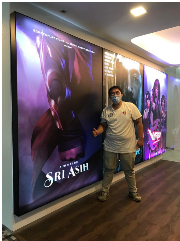
Gambar 2.1 Depan Kantor PT. Screenplay Bumilangit Produksi

PT. Screenplay Bumilangit Produksi adalah sebuah Rumah Produksi di Indonesia yang berfokus pada development dan pendanaan produksi film-film superhero genre aksi berdasarkan komik superhero Indonesia dan kultur pop kontemporer. PT. Screenplay Bumilangit Produksi dibuat pada tahun 2018 menjadi bagian kerjasama dari Screenplay Films dan Bumilangit Studio. PT. Screenplay Bumilangit Produksi bertempat di SCTV Tower Lantai 15 bersamaan dengan Screenplay Films. (Bumilangit, 2020)