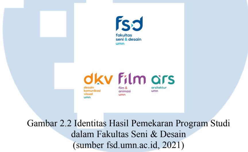
Gambar 2.2 Identitas Hasil Pemekaran Program Studi dalam Fakultas Seni & Desain

diambil pada semester 5. Lalu, pada September 2016, Program Studi Film dan Televisi (FTV) sudah berdiri sendiri hasil pemekaran Fakultas Seni & Desain. Pada tahun 2019, Program Studi Film & Televisi menyatakan bahwa mulai semester depannya, Prodi ini akan disebut sebagai Prodi Film saja tanpa Televisi karena sudah mulai ditinggalkan, dan mata kuliah mengenai Televisi dalam 4 tahun kurikulum pembelajaran hanya ada satu, dengan bobot tiga sks.