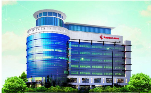
Gambar 2.2 Wajah dari kantor pusat Kawan Lama Sejahtera

Visi Kawan Lama Group adalah Bisnis Keluarga untuk Keluarga. Maksud dari visi ini adalah Kawan Lama merupakan sebuah bisnis yang dibangun oleh sebuah keluarga, yang didalamnya berisi kumpulan orang dengan sistem kekeluargaan yang menargetkan customer dari sisi personal dan kekeluargaan. Misi Kawan Lama Group adalah memberikan nilai – nilai untuk kehidupan yang lebih baik melalui perkembangan bisnis dan pertumbuhan yang berkelanjutan.