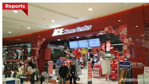
Gambar 2.5 ACE Hardware terbesar di dunia yang berlokasi di Living World

Indonesia bahkan memiliki toko ACE Hardware terbesar didunia yang berada di Living World, Alam Sutera. Toko ini memiliki luas 15.000 m 2 dan terdapat 2 Lantai. Pada tanggal 25 April 2014, Toko ke 100 ACE Hardware dibangun di Lenmarc Mall, Surabaya.