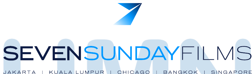
Gambar 2.1 Logo Seven Sunday Films